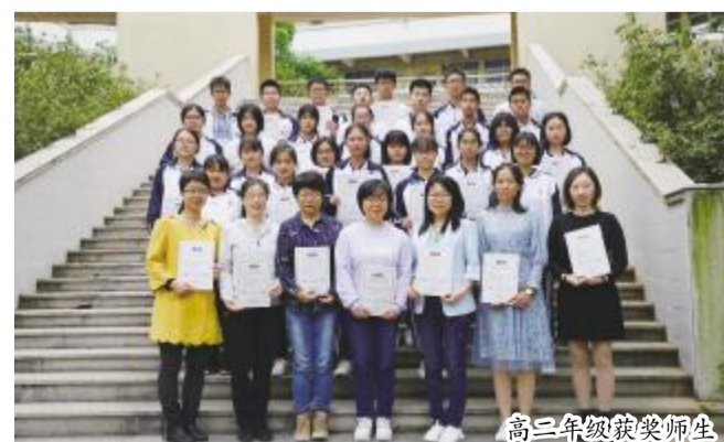
高二年级获奖师生

为了更好地激发学生学习英语的兴趣,拓展视野,培养学生的英语学科素养,我校高一和高二年级选派选手参加了 2019 年 12 月举行的“第十五届 IEEA 英语能力大赛”,取得优异成绩,共有 164 名