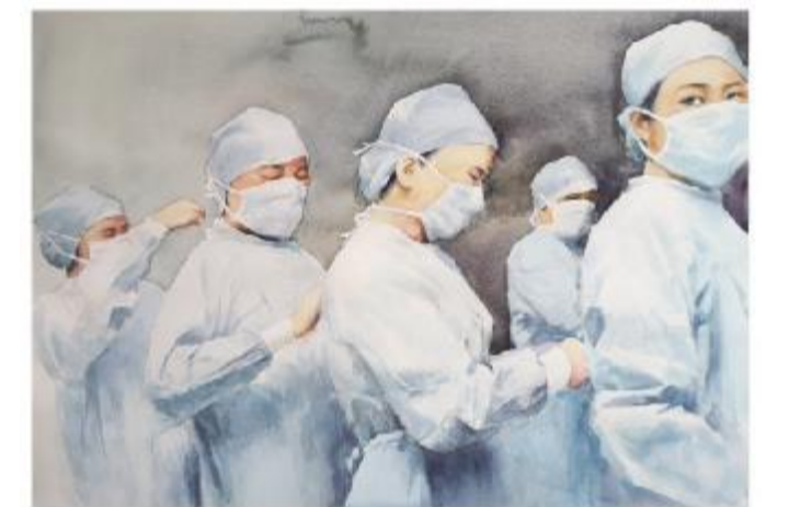
水彩画《白衣天使》 因建伟