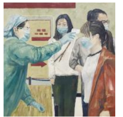
油画《大家一起加油》 罗涛