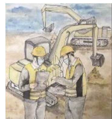
钢笔水彩《复工复产》 高二(6)班 梁健敏