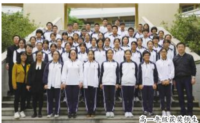
高一年级获奖师生

Our Students Have Achieved Great Success in the 15th IEEA English Proficiency Competition